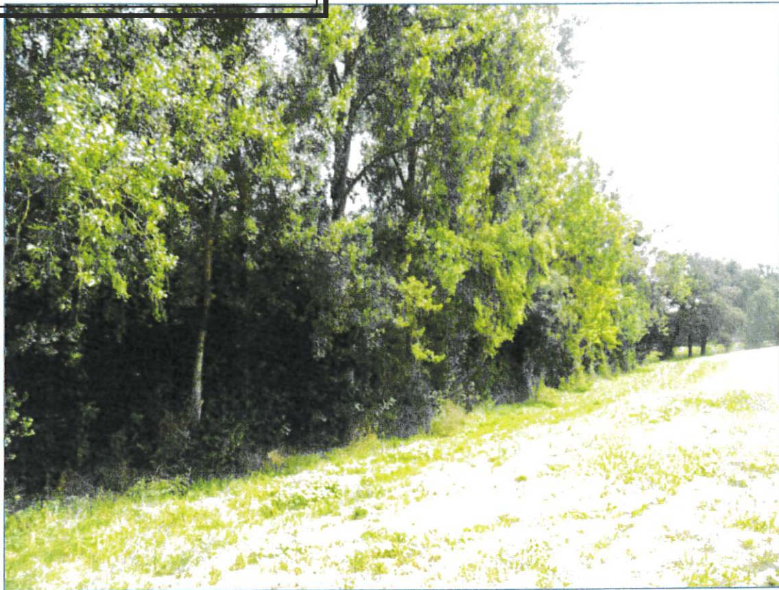
Exemple de peupliers qui seront supprimés