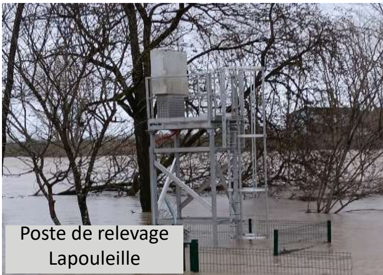
Poste de relevage Lapouleille