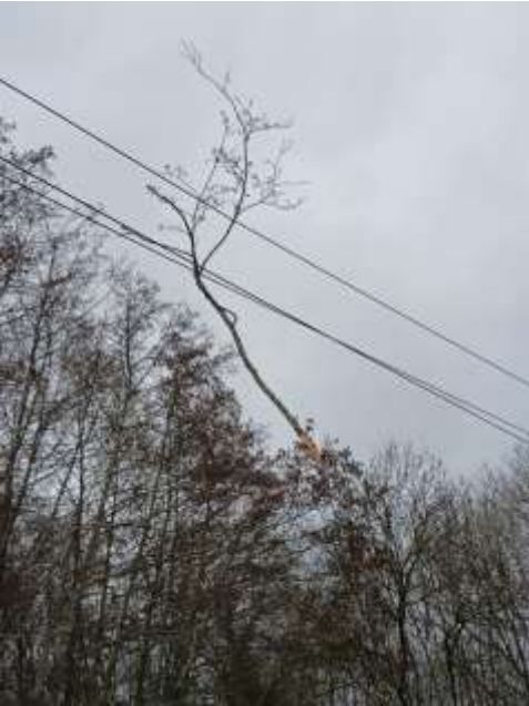
Station de Bayssac (Monflanquin)