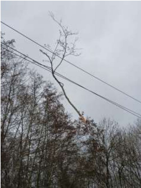
Station de Bayssac (Monflanquin)