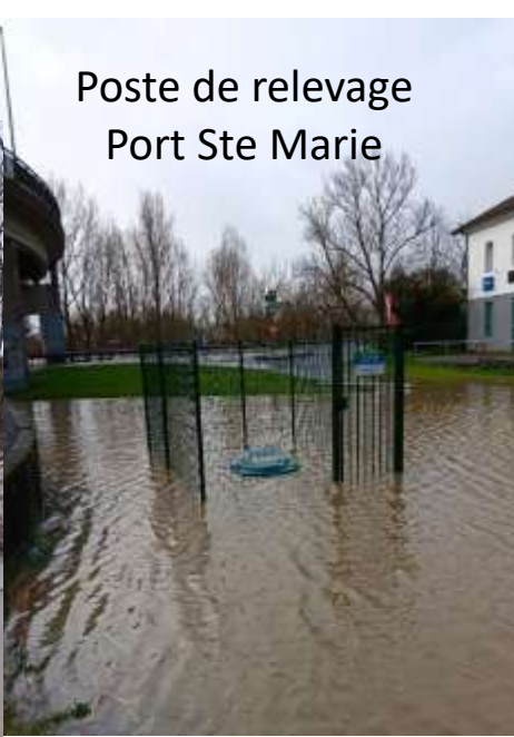
Poste de relevage Port Ste Marie