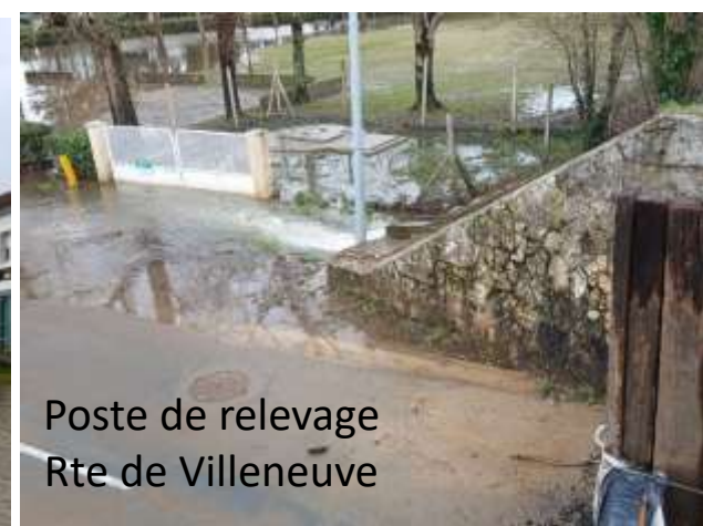
Poste de relevage Rte de Villeneuve