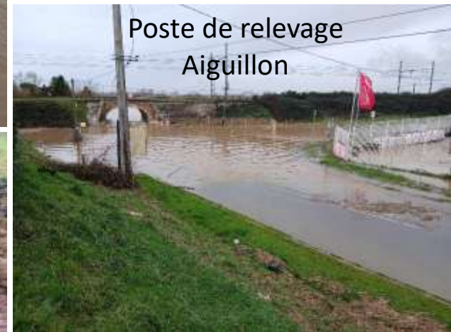
Poste de relevage Aiguillon