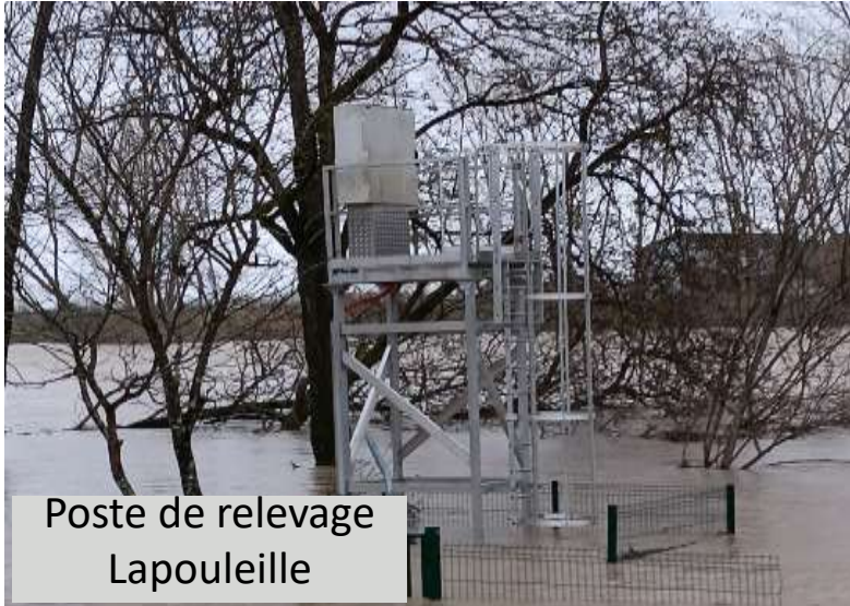
Poste de relevage Lapoueille