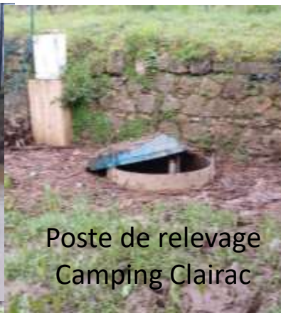
Poste de relevage Camping Clairac